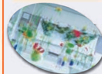
2年8組 「北高一受けたい授業」