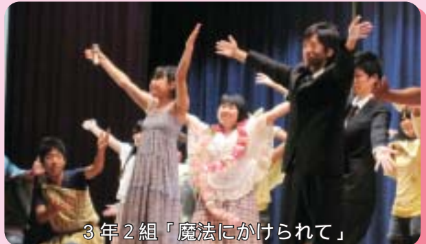
3年2組 「魔法にかかれて」