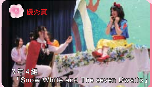
3年4組 「Snow White and The seven Dwaifs」