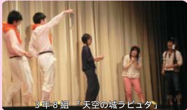
3年8組 「天空の城ラピュタ」