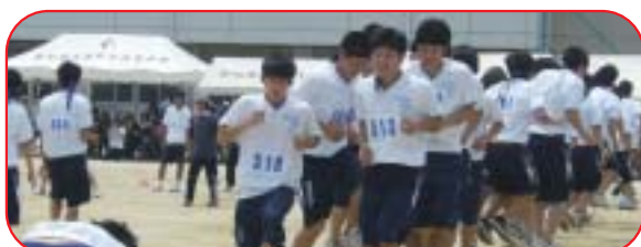
みんなでジャンプ 3-5 新記録 103回!