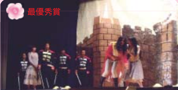
3年3組 「ベルサイユのバラ」