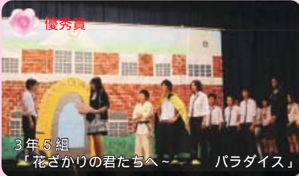
3年5組 「花ざかりの君たちへ～ パラダイス」