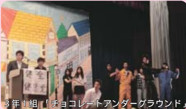
3年1組 「チョコレートアンダーグラウンド」