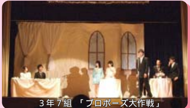
3年7組 「プロポーズ大作戦」