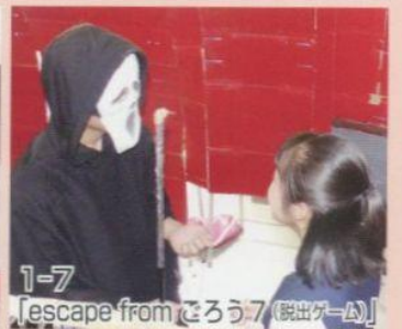
1-7 「escape from せろう7 (脱出ゲーム)」