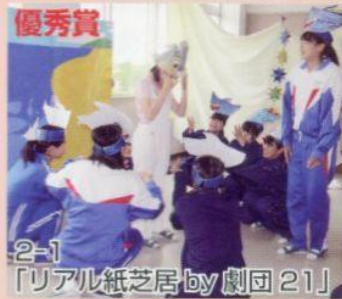
2-1 「リアル紙芝居 by 劇団 21」