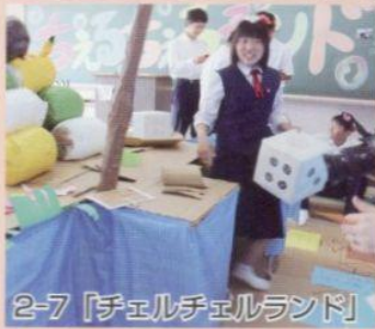
2-7 「チェルチェルランド」

今年度の玄武祭は3年生の舞台発表の完成度がとても高く驚きました。また、1、2年生の教室発表や吹奏楽部の演奏、軽音楽部のライブ、有志発表などのたくさんの魅力的な発表があったので、とても良かったと思います。