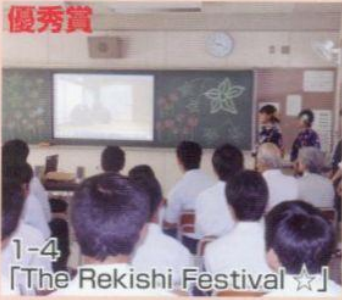
1-4 「The Rekishi Festival ☆」