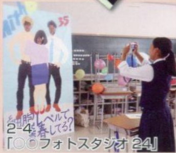
2-4 「胸をベルで叩く?」 「○○フォトスタジオ 24」