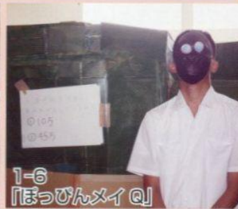
1-6 「ぼっぴんメイ Q」