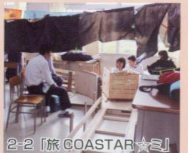
2-2 「旅 COASTAR ☆」