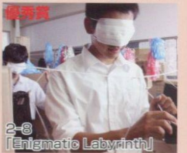
2-8 「Enigmatic Labyrinth」