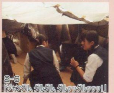
2-6 「ジャンク、グルグル、グルグルッ!!」