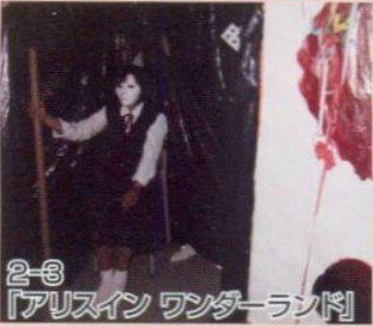
2-3 「アリスイン ワンダーランド」