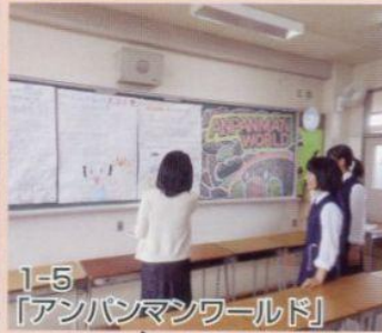
1-5 「アンパンマンワールド」