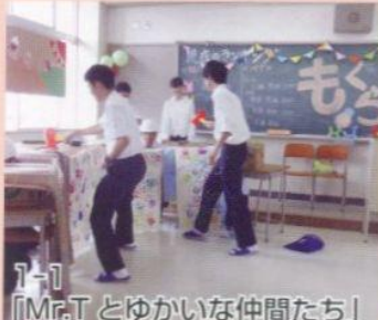
1-1 「Mr.T とゆかいな仲間たち」