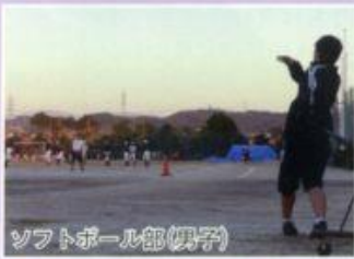
ソフトボール部(男子)