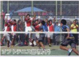
ソフトテニス部(男子)