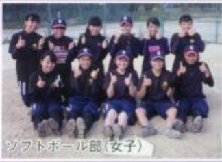
ソフトボール部(女子)