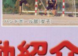
ハンドボール部(女子)