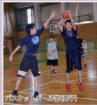
バスケットボール部(男子)