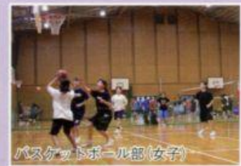
バスケットボール部(女子)