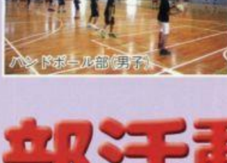
ハンドボール部(男子)