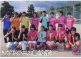
ソフトテニス部(女子)